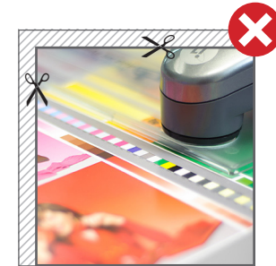
■ Fig. 1: Hintergründe bitte immer vollflächig anlegen. // Fig. 1: Please use backgrounds full surface.