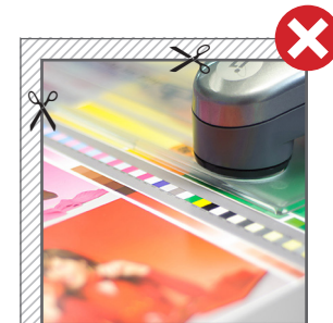
■ Fig. 1: Hintergründe bitte immer vollflächig anlegen. // Fig. 1: Please use backgrounds full surface.