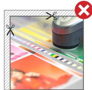
■ Fig. 1: Hintergründe bitte immer vollflächig anlegen. // Fig. 1: Please use backgrounds full surface.