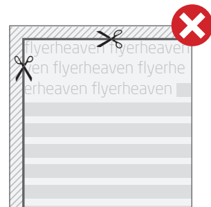
■ Fig. 2: Texte bitte immer mit einem Sicherheitsabstand zur Schneidekante anlegen. // Fig. 2: Please insert text always with a safety margin from the cutting edges.