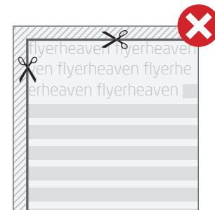
■ Fig. 2: Texte bitte immer mit einem Sicherheitsabstand zur Schneidekante anlegen. // Fig. 2: Please insert text always with a safety margin from the cutting edges.